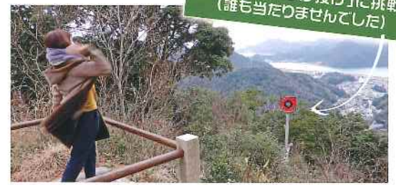
この的に当たれば願いが叶うという「かわらけ投げ」に挑戦!(誰も当たっていません)