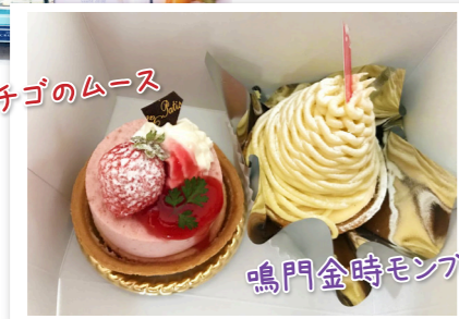
鳴門金時モンブラン

今回で紹介するのは、「パティスリー コンサクレ・カイ 学園都市店」。神戸、西明石、稲美町に4店舗あります。おすすめは半熟フロマージュ ふわわです。ふわは口に入れると名前の通りふわっと半熟のようにとろける触感が楽しめるチーズケーキです。こちらのケーキは今までに何度も受賞歴がありメディアにも取り上げられていたことがあるようです。