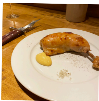
丹波鶏のコンフィ