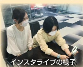
インスタライブの様子

6月29日に be.love.company. 様が主催する「SNSフェスティバル」を受講し、中小企業4社のSNS広報活動について聞くことができました。共通していることは「継続すること」。また社員の姿を載せて親しみやすさを出すことで、安心・信頼を得ることが大切だと学びました。