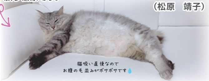
猫吸い直後なので お腹の毛並みがボサボサです