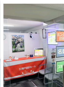
ドアが空いている時