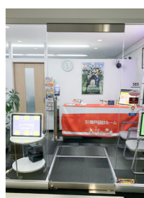
ドアが閉まっている時